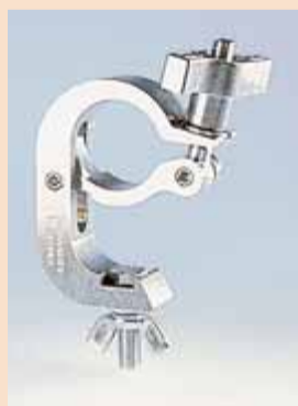
Standard Trigger Clamp

TLC verkauft nebst sämtlichem Zubehör, wie Gaffer-Tape und Sicherungsseilen in allen Dimensionen und Längen, seit langem auch das gesamte Doughty Scheinwerferhacken Programm. Der neueste Hit ist der Quick Trigger Clamp, konzipiert als Ergänzung