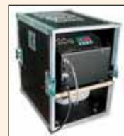
Captain D. Case

Captain D. ist seit Jahren der Renner auf dem Markt und hat sich somit bestens bewährt. Die neue, überarbeitete Version hat mehr Power und verfügt neu über digitale Technik. DMX 512 Ansteuerung ist selbstverständlich, optional ist eine Funk- oder Kabelfernbedienung erhältlich.